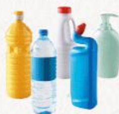
bouteilles et flacons en plastique