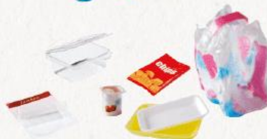
tous les autres emballages en plastique