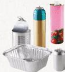
emballages en métal