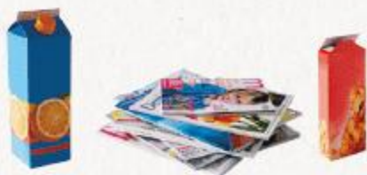
papiers, emballages et briques en carton