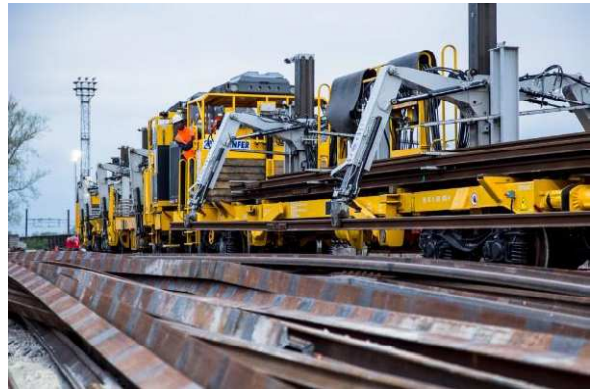
Déchargement vieux rail