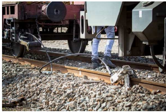
Déchargement des longs rails soudés