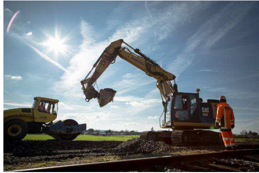
Terrassements – Réfection de la plateforme