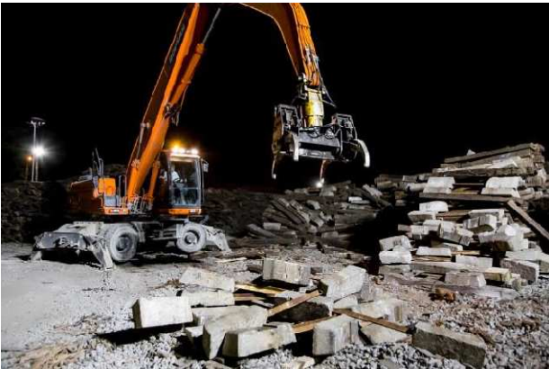
Tri des vieilles traverses (bois / béton)