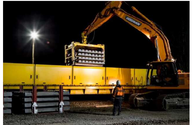
Rechargement en traverses neuves