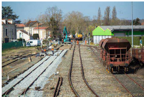
Travaux de voie en gare de Bergerac