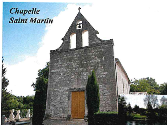
Chapelle Saint Martin

Manifestation co-organisée par les communes de Lamonzie-Saint-Martin et de Prignonrieux, avec la collaboration de la Canneville Gardonnaise, l'association de Canoë-Kayak de Port-Sainte-Foy