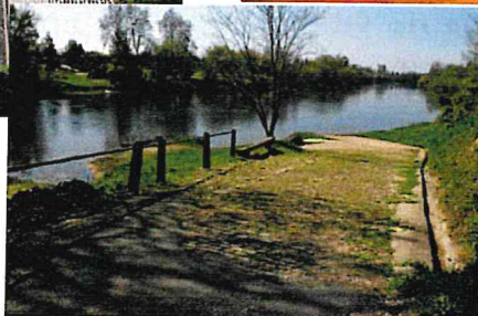
La cale à Prignonrieux

Restauration proposée par Paul Traiteur (Lamonzie), / MIDI et le restaurant-traiteur Le Resto (Prignonrieux) / SOIR